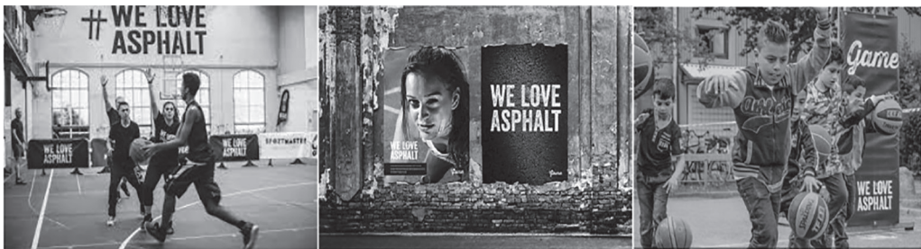
Figur 2. Billeder er fra GAMEs hjemmeside og viser brugen af deres #weloveasphalt som anvendes til plakater i byen, streetbasket kampe i Street Mekka i København og til gadeidræts events i lokale GAME-zoner.

I de repræsenterede interviews, på GAMEs hjemmeside, Instagram, Facebook, i GAME the Movie på Youtube, og i form af GAMEs hashtag og logo #weloveasphalt, som står trykt på diverse merchandise, fremstår asfalt som en materialitet, der tillægges en særlig betydning i GAME. De såkaldte GAME Streetmekkas omtales som «råt og asfalteret gadeidræts- og kulturhus» med «uformelle rammer» (GAME, 2018). I et socialsemiotisk perspektiv fremstår asfalt som en modalitet, der skaber identifikation og tilhørsforhold til GAME som fritidstilbud. Asfaltens potentiale udtrykkes, som det illustreres nedenfor, på forskellig vis. Dels har den et konkret fysisk potentiale til eksempelvis at danse, spille basket og street fodbold. Dels kommunikerer asfalt en særlig social måde at være sammen på.